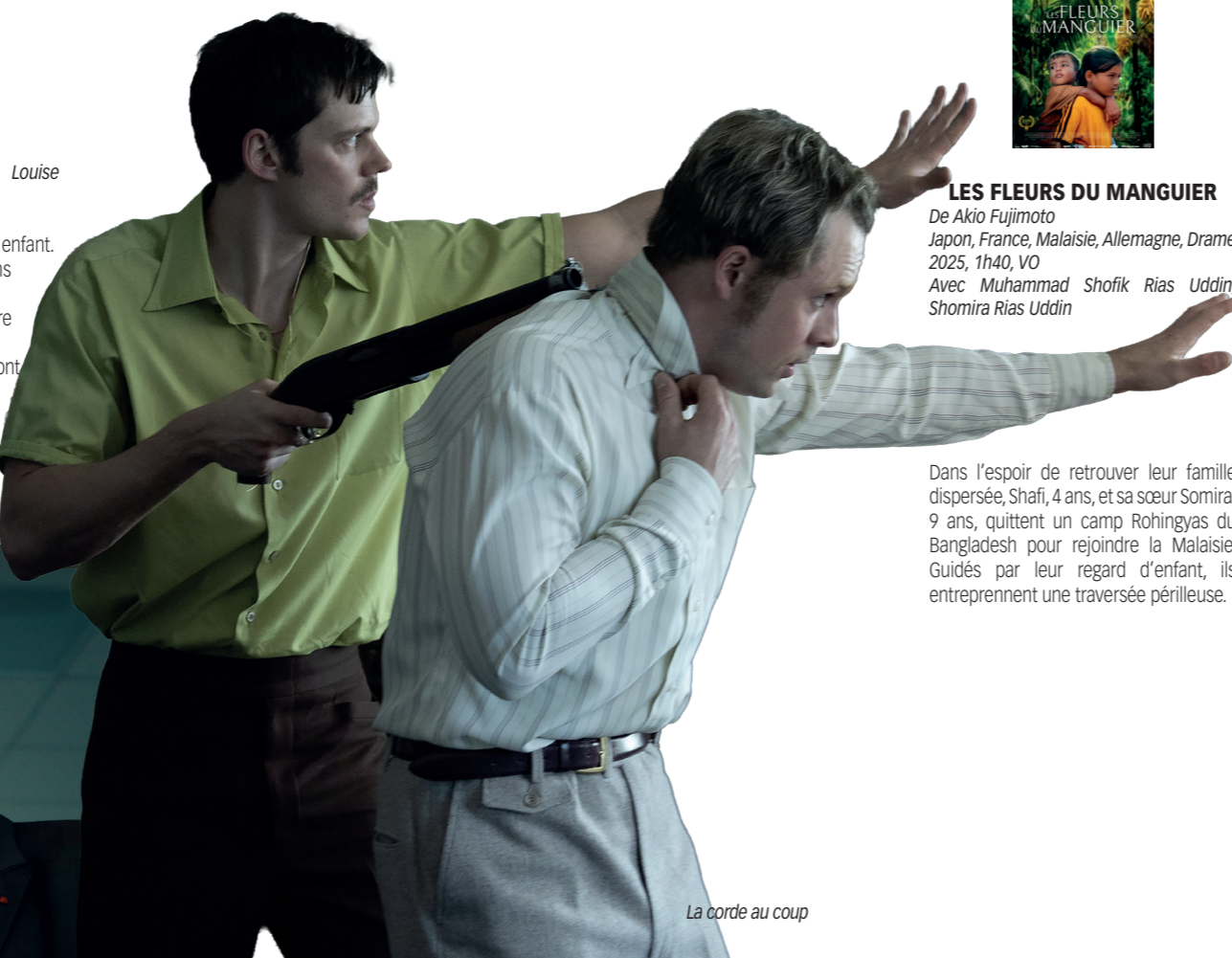
La corde au cou