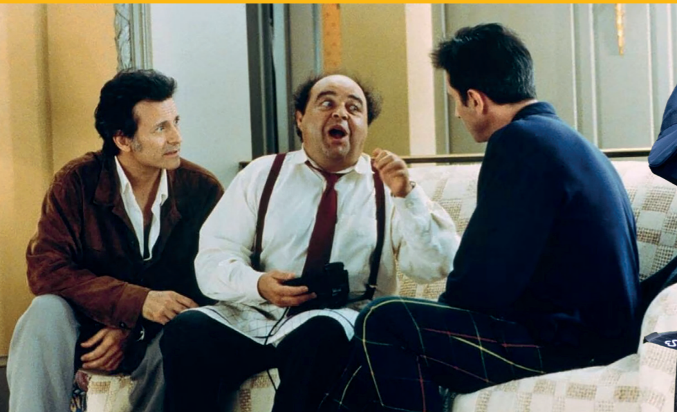
Le dîner de cons

Tarifs : 3,50 € pour les moins de 15 ans, 4 € pour les adultes Réservations conseillées : cinema@lesulis.fr